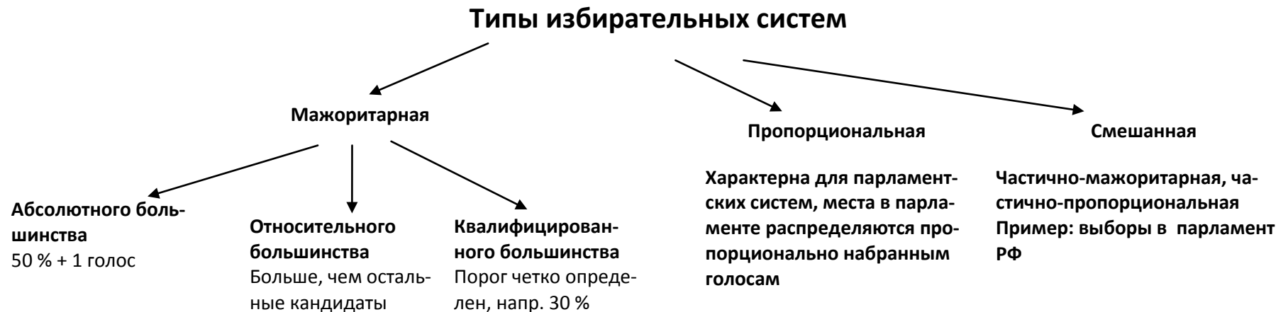
Рисунок 1 – Избирательные системы

Избирательная система – это совокупность установленных законом правил, принципов и критериев, на основе которых определяются результаты голосования